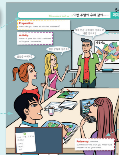
Illustration The topic is clearly represented through a picture.

Sample Dialogues Sample dialogues are provided for students to refer to during the task.